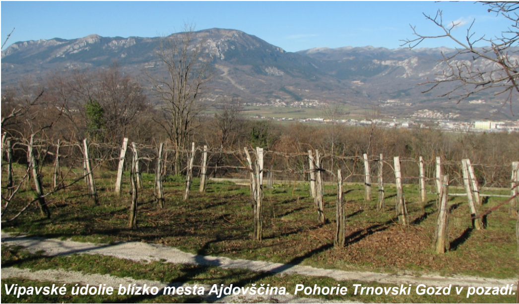
Vipavské údolie blízko mesta Ajdovščina. Pohorie Trnovski Gozd v pozadi.