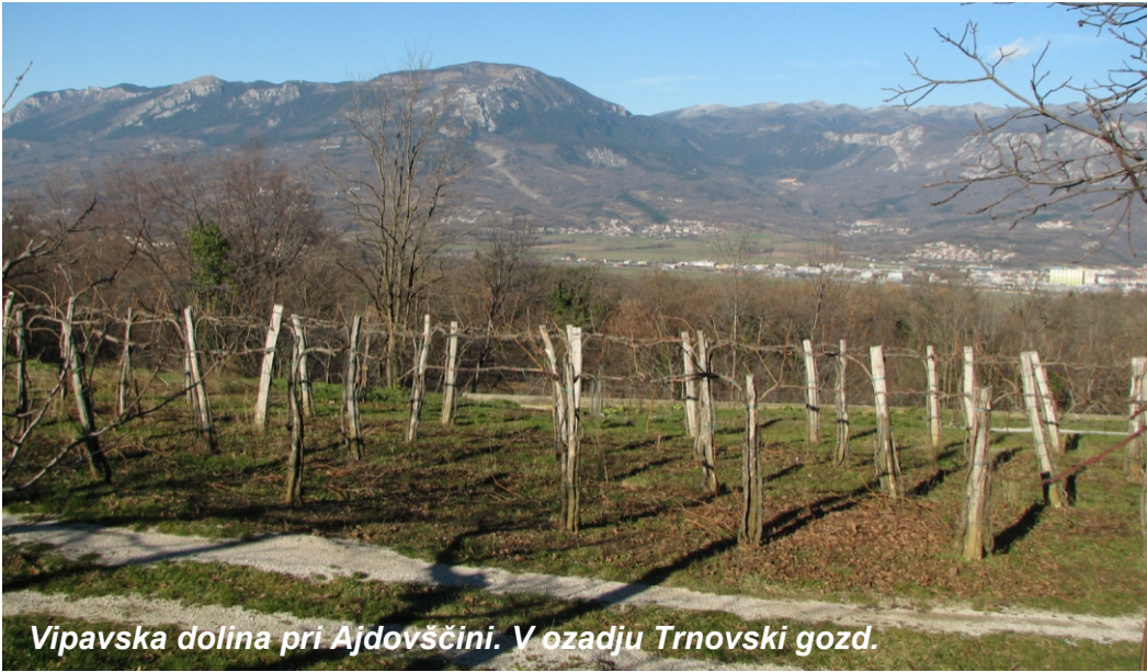
Vipavska dolina pri Ajdovščini. V ozadju Trnovski gozd.