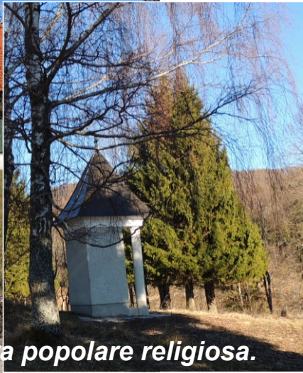
Una casa colonica e relativa architettura popolare religiosa.